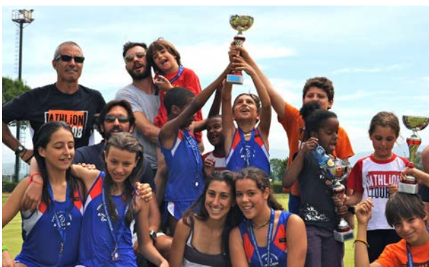
Uno spaccato dell'equipaggio dell'Athlionbus

Ci aspetta una nuova stagione, e ci attendono nuove sfide in tempi difficili e di crisi che inevitabilmente colpisce anche la nostra Azienda. Ma l'Athlionbus non si può fermare e non si fermerà! Sono ancora molti i viaggi che ci attendono, le mete da raggiungere e tanti i viaggiatori da accompagnare e siamo sicuri che con l'aiuto e il supporto di tutti voi unitamente alla nostra passione e spirito di servizio, potremo continuare ed essere sempre più "competitivi ed efficienti"!