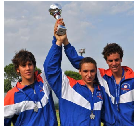
La squadra RAGAZZI 2^ class. ai Campionati Italiani